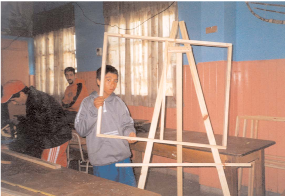
Taller de carpintería en la Escuela N° 35 "Nicolás Avellaneda" de Lanús.

"Hoy estoy muy emocionado porque tengo muchas ganas de vivir y tengo una gran oportunidad de comprar hojas, lápices de colores, también ropa. Aunque la seño me dé todo, sería muy bueno comprármelo yo con mi plata".