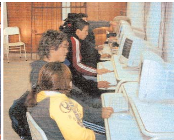
Escuela Docencia Tucumana: Taller de reciclaje. Taller de informática.