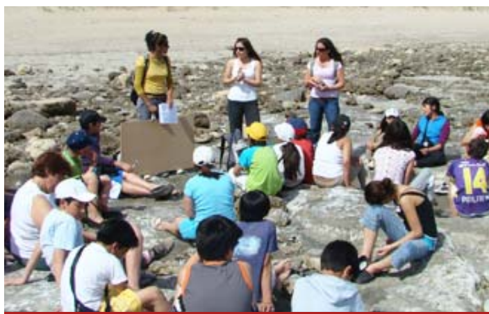
Estudiantes en Puerto Pirámides.

La Dirección Nacional de Políticas Socioeducativas, a través del Programa Federal de Turismo Educativo y Recreación, firmó un convenio con Ministerio de Educación de Chubut que permite realizar campamentos con estudiantes de otras jurisdicciones en las bases de la provincia.