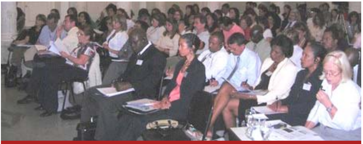
Asistentes de Argentina y de América Latina y el Caribe en el Salón Blanco del Palacio Sarmiento.

Además, está prevista la publicación en la web de las conferencias y debates de los talleres de este seminario que contó con la presencia de referentes socioeducativos de todas las provincias argentinas y de autoridades de las carteras educativas de Belice, Brasil, Canadá, Costa Rica, Ecuador, El Salvador, Granada, Guatemala, Guyana, Haití, Honduras, México, Panamá, Paraguay, Saint Kitts y Nevis, San Vicente y las Granadinas, Santa Lucía, y Uruguay.