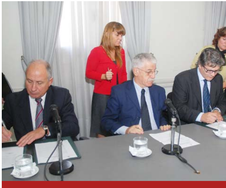
Firma de los convenios en el Palacio Sarmiento.